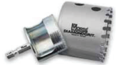
Brocasiera con Granalla de Diamante Diamond Grit Hole Saws