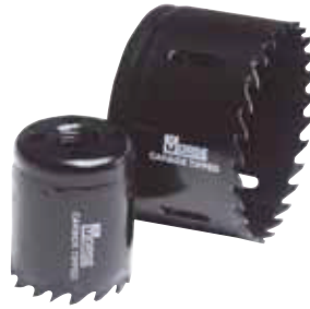
Brocasiera con Inserto de Carburo Carbide Tipped Hole Saws