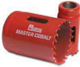
Brocasiera Bimetálica Bi-Metal Hole Saws