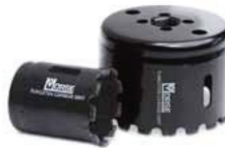
Brocasiera con Granalla de Carburo Carbide Grit Hole