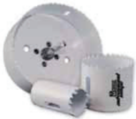
Brocasiera Bimetálica Premium Advanced Edge Bi-Metal Hole Saw